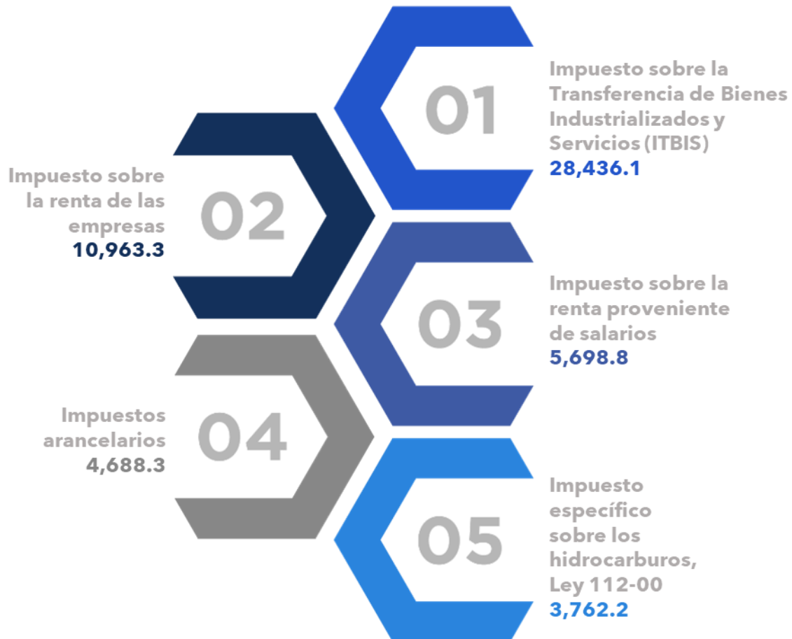
Ilustración 1. Figuras Impositivas con Mayor Recaudación En millones de RD$

Nota: Fecha de imputación al 30/09/2023 // Fecha de registro al 07/10/2023.